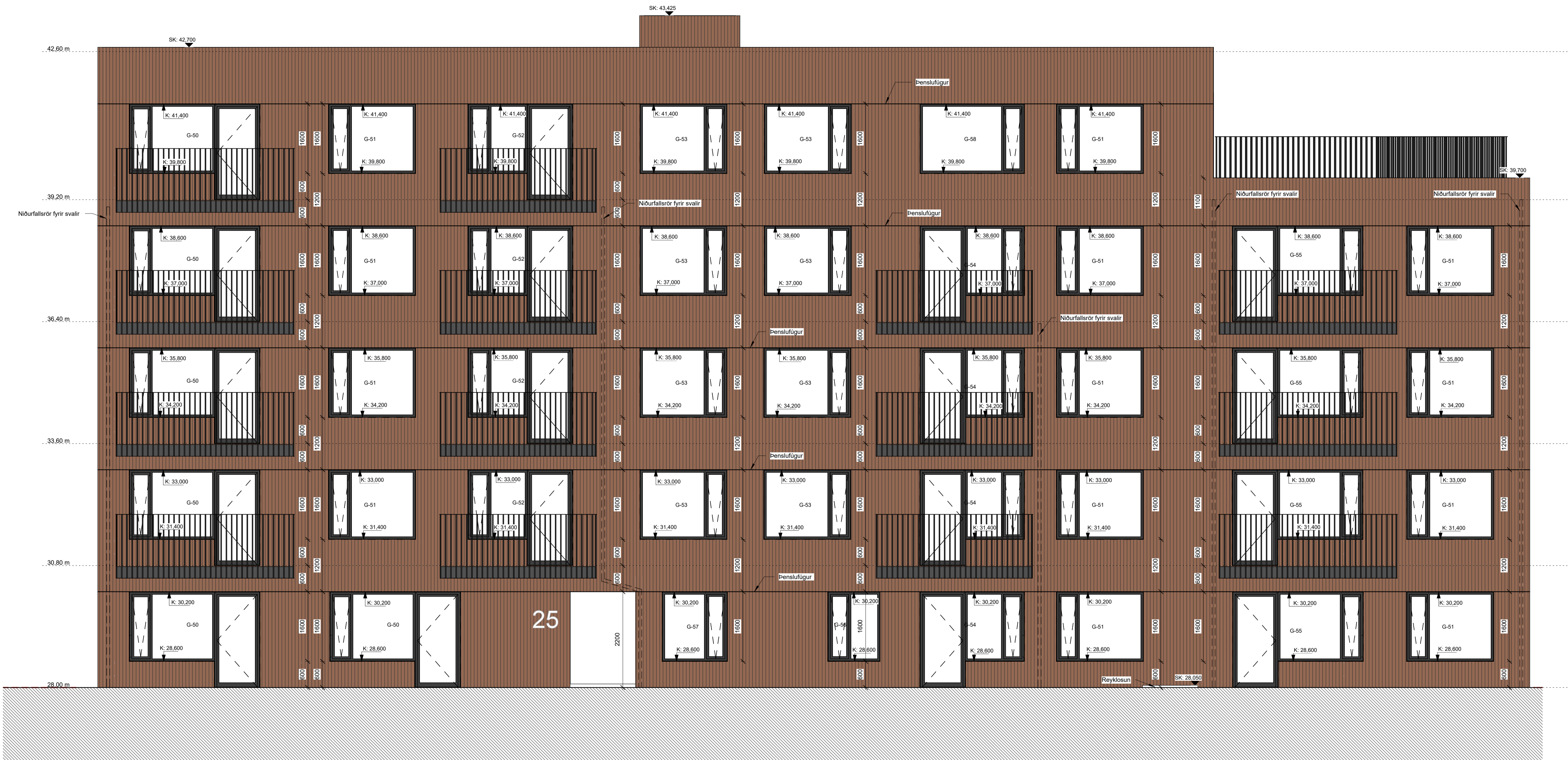
02-Suður VERK - hluti 2 - mhl. 01 1:50

Öll má takist/staðfærís á staðnum áður en smíði hefst. Misræmi í teikningum skal tafarlaust tilkynna hönnuðum. Teikningar arkitekta skal lesa með teikningum meðhönnuða.