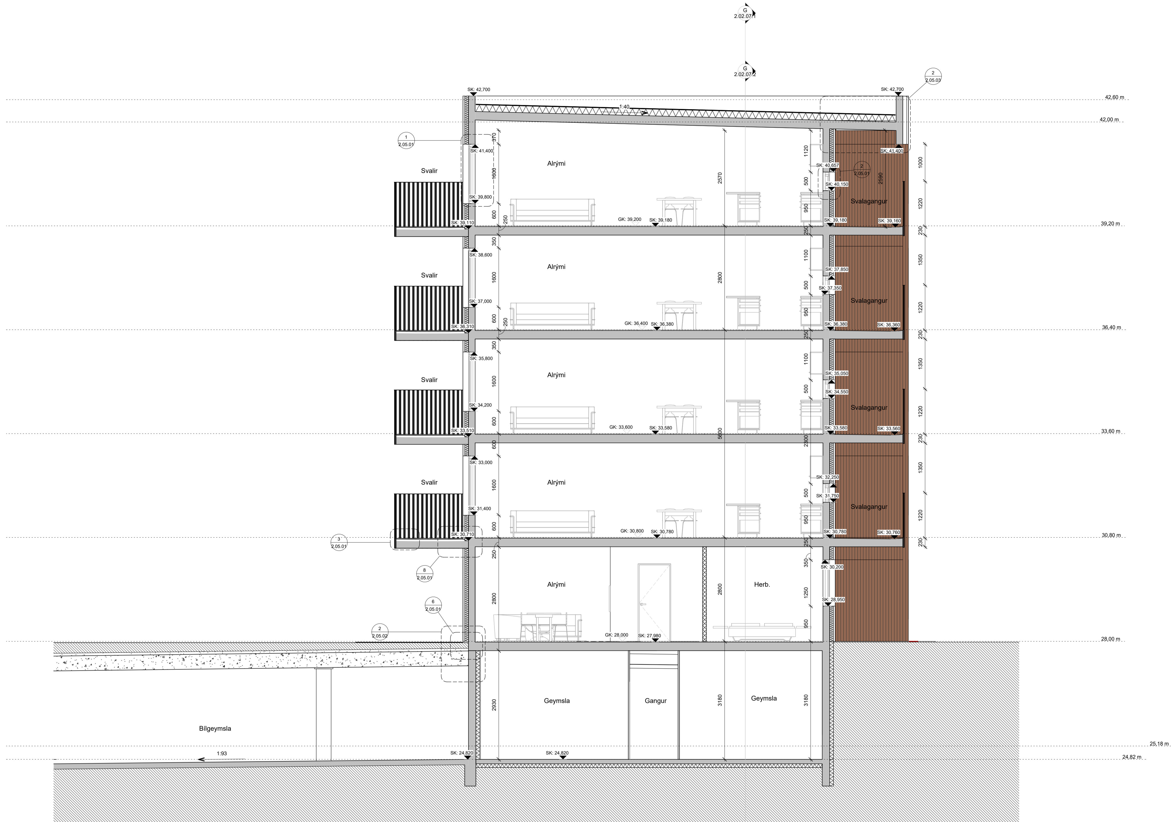
Sneiðing CC VERK Mhl. 01 og 03 1:50

Öll máli takist/staðfærís á staðnum áður en smíði hefst. Misræmi í teikningum skal tafarlaust tilkynna hönnuðum. Teikningar arkitekta skal lesa með teikningum meðhönnuða.