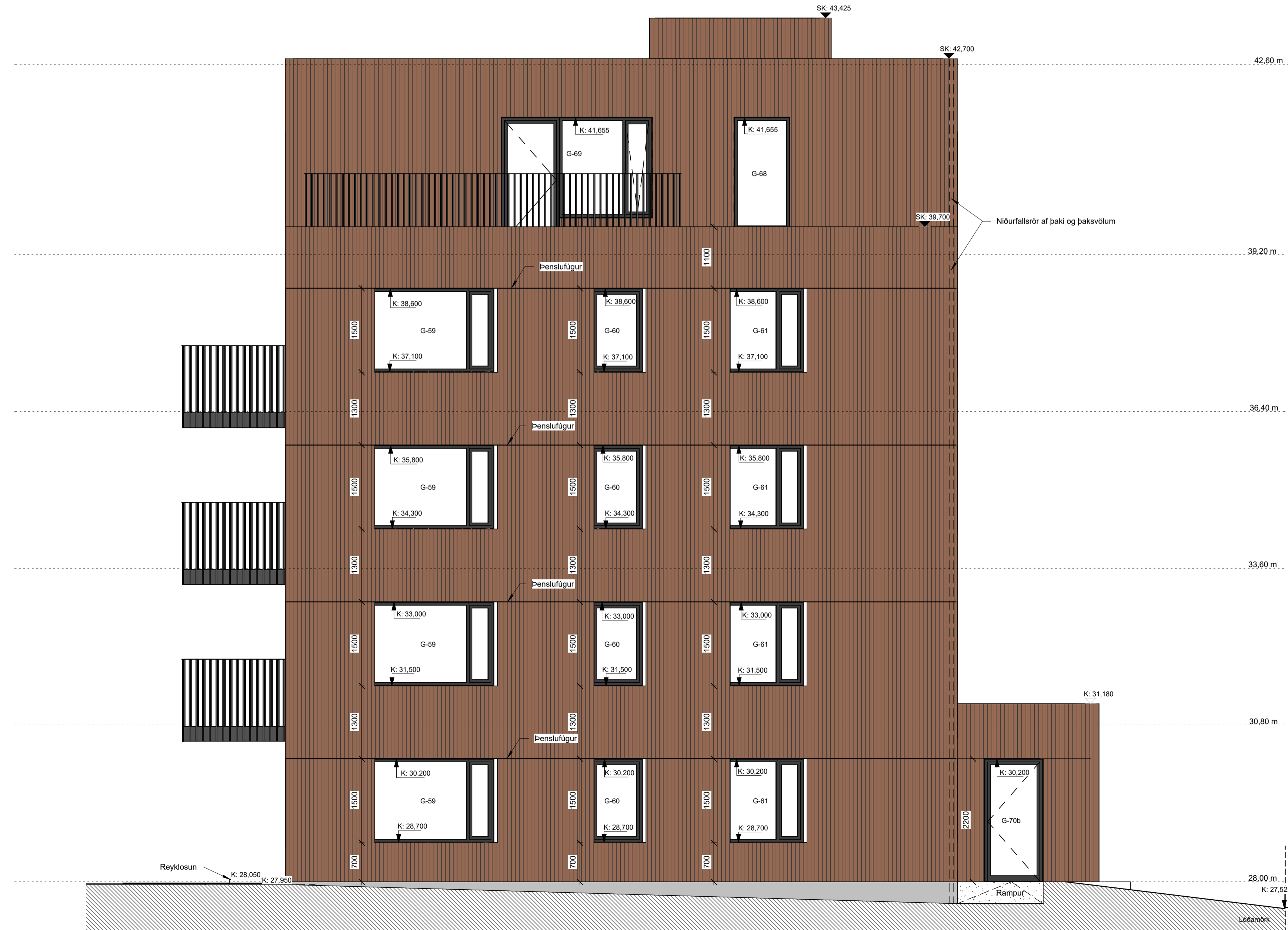
08-Austur VERK - hluti 2 - mhl. 01 1 : 50