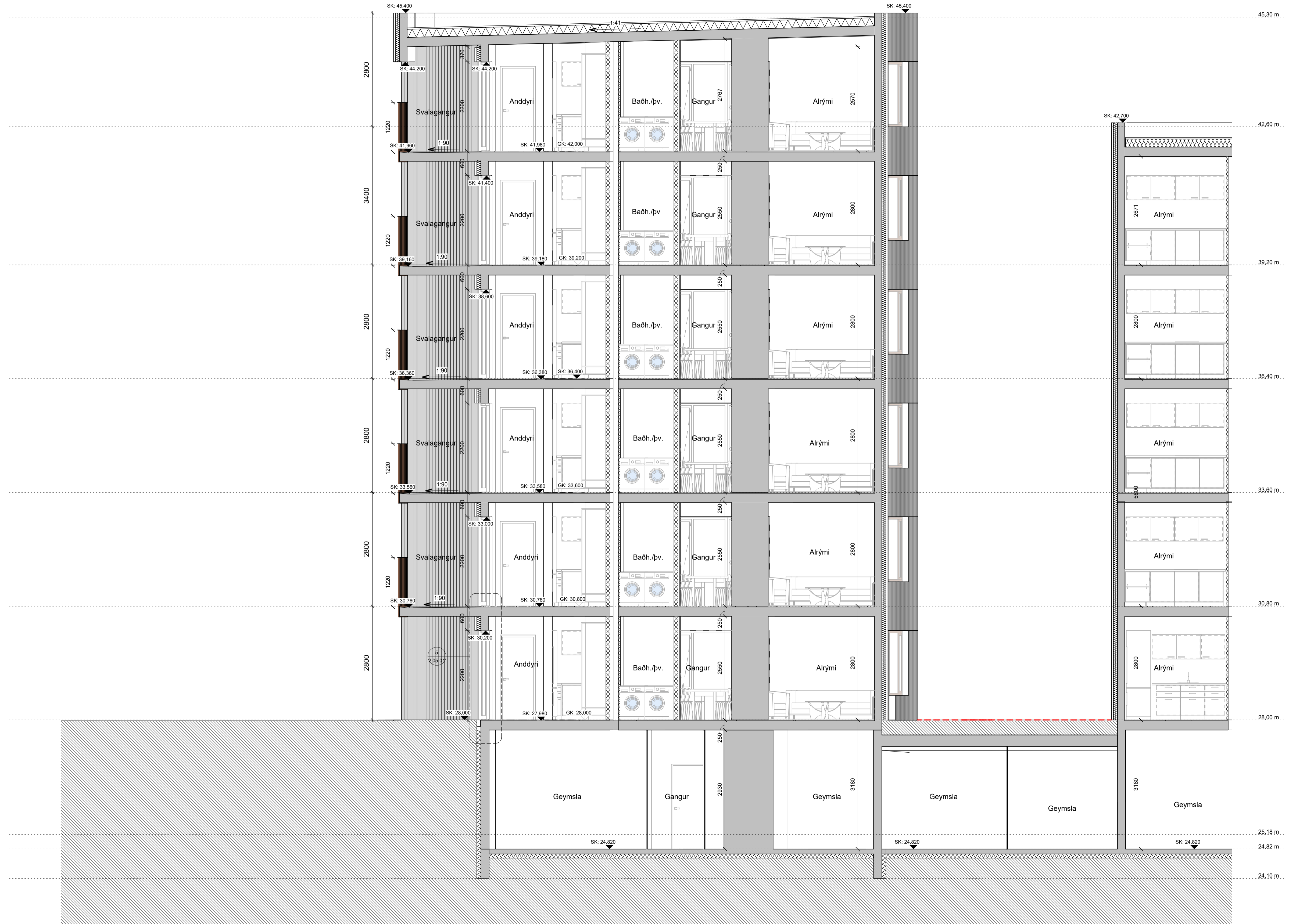
Sneiðing GG VERK Mhl. 01, 02 og 03 1:50

Öli má takist/staðfærís á staðnum áður en smíði hefst. Misræmi í teikningum skal tafarlaust tilkynna hönnuðum. Teikningar arkitekta skal lesa með teikningum meðhönnuða.