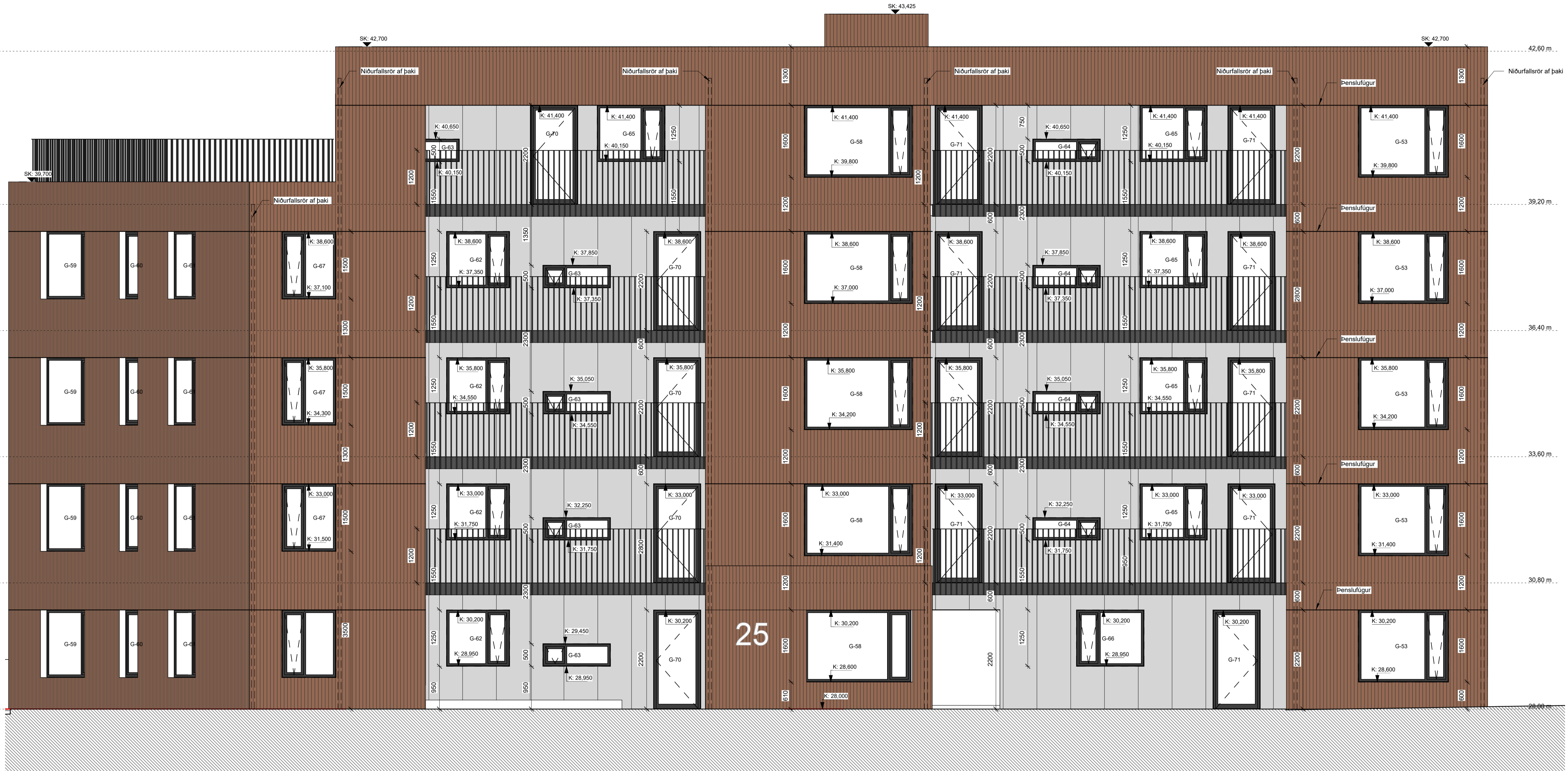
04-Norður VERK - hluti 1 - mhl. 01

Öll mál takist/staðfærís á staðnum áður en smíði hefst. Misræmi í teikningum skal tafarlaust tilkynna hönnuðum. Teikningar arkitekta skal lesa með teikningum meðhönnuða.